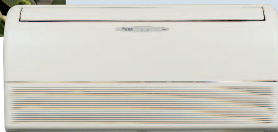
Вътрешно тяло на FLKS/FLXS